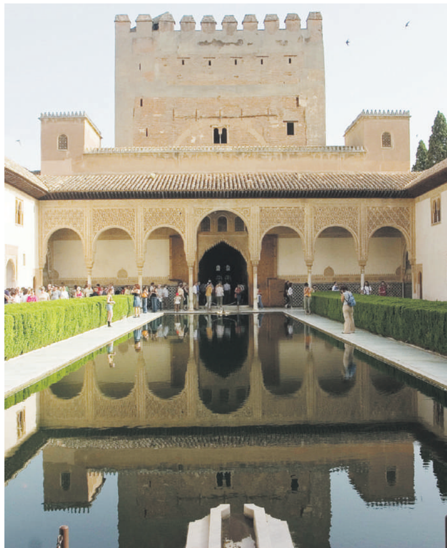
El Palacio de Comares, considerado una de las joyas arquitectónicas de la Alhambra. Adyacente está la Torre de Comares, con 150 pies de alto, desde donde se puede tener una vista panorámica de toda La Alhambra y sus alrededores.

La llamada "tierra soñada", Granada, ciudad ubicada al sur de España, en la comunidad autónoma de Andalucía, es considerada una de las ciudades más bellas de España y Europa. Con un impresionante legado andaluz que se suma a joyas arquitectónicas del Renacimiento, ahora también cuenta con los servicios de los trenes de alta velocidad AVE que empezaron a funcionar el mes pasado. En lo más alto de la montaña La Sabika y rodeada por murallas antiguas, están ubicada estratégicamente La Alhambra y los Jardines del Generalife. Este es un hermoso conjunto de palacios, edificios y torres con elaborada arquitectura y fachadas con diseños y textos en árabe. Además, hay patios, estanques con fuentes de agua, esculturas, variedad de árboles y jardines para la ornamentación. Este impresionante conjunto que conforman la ciudadela amurallada de