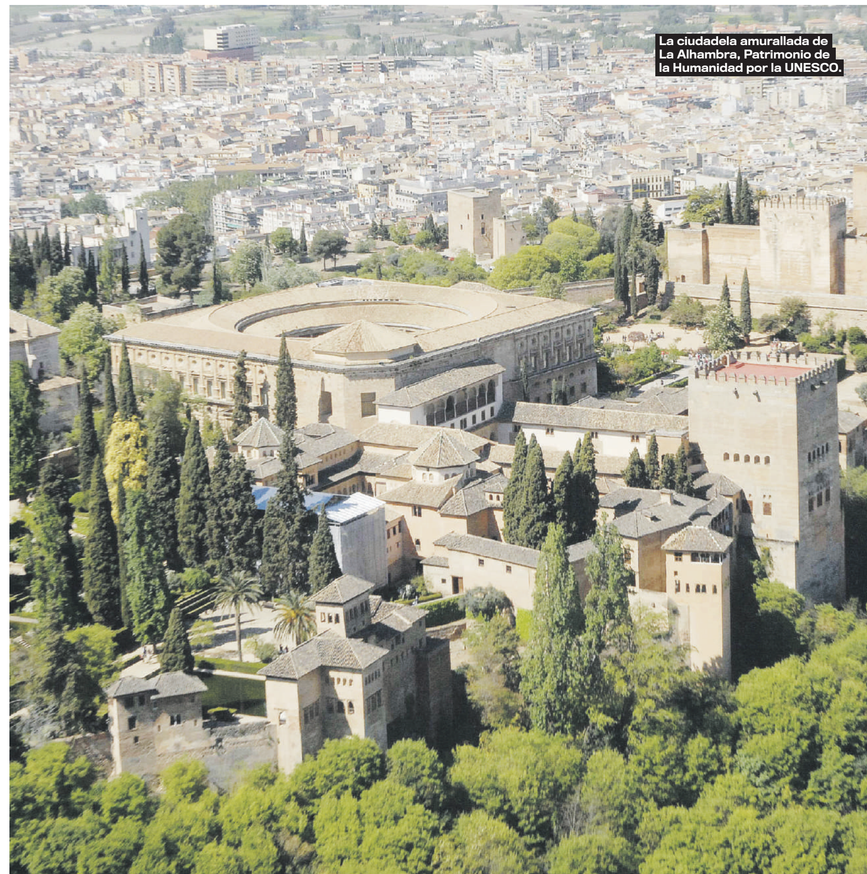
La ciudadela amurallada de La Alhambra, Patrimonio de la Humanidad por la UNESCO.

BARRIO DEL ALBAICÍN No te debes perder un paseo por el antiguo barrio árabe del Albaicín, declarado Patrimonio de la Humanidad por la Unesco. Pasea por sus empinadas y estrechas callejuelas y descubre sus casas blancas, típicas de los países árabes y mediterráneos. Llega hasta el mirador de San Nicolás y aprovecha para ver La Alhambra al atardecer.